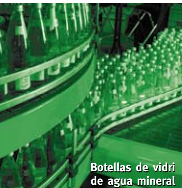
Botellas de vidrio de agua mineral