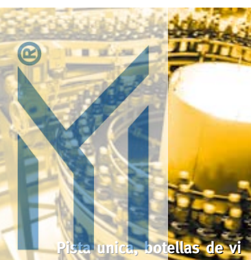
Pista única, botellas de vi

La SpiralVeyor® SVM ha sido diseñada para elevar botellas y latas individuales por separado o en flujo de masa. Su diseño compacto, robusto y sencillo la convierte en una solución revolucionaria. La banda patentada de AmbaFlex con guías de rodillos laterales permite múltiples bobinados. Se trata de una solución innovadora que favorece una distribución mucho más efectiva para las líneas de llenado.