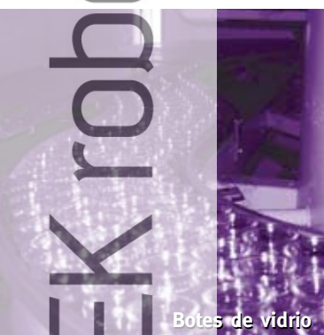
Botes de vidrio