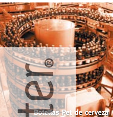
Botellas Pet de cerveza